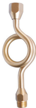
Rabo de Porco "Pig Tail"